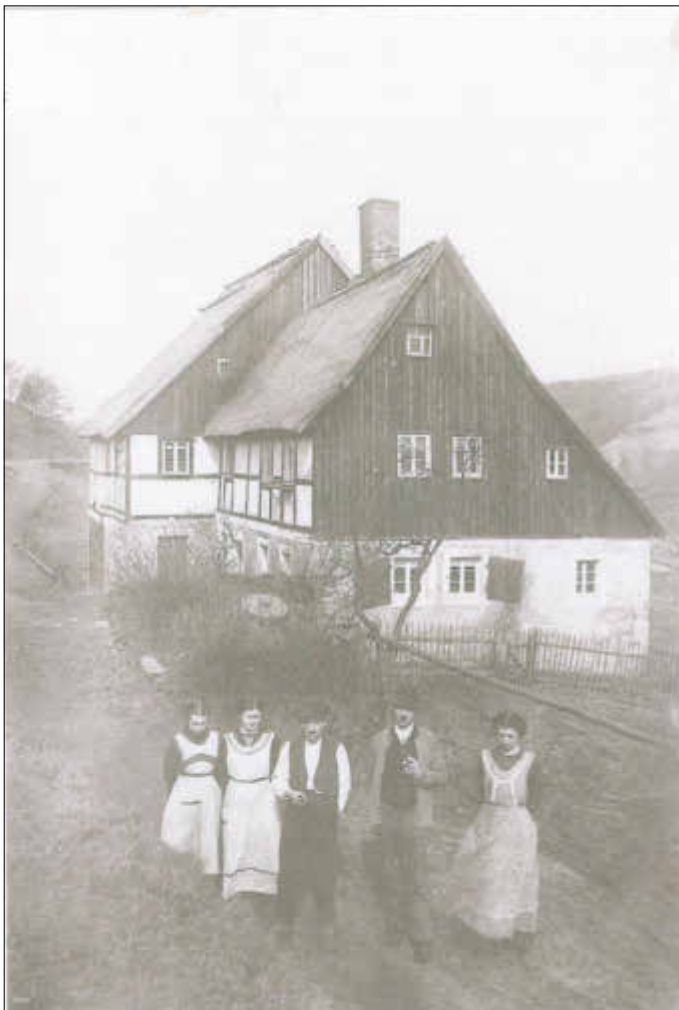
Steigers vor ihrem noch mit Stroh gedeckten Haus um das Jahr 1920

Er starb im Alter von 53 Jahren und 18 Wochen, vermutlich als Junggeselle. Nach dem Jahr 1700 gehörten ihm sehr wahrscheinlich alle drei Häuser. Die ursprünglich seinem Vater gehörenden Häuser am Pfarrsteig und der Freiburger Straße wurden 1701 und 1702 verkauft.