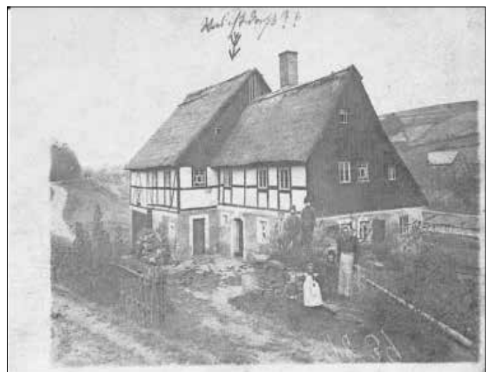
Am Roten Graben 2 um das Jahr 1908

Nach der Festnahme Lips Tulians 1711 in Freiberg und dem Geständnis von 50 Taten wurde er am 8. März 1715 mit weiteren vier Bandenmitgliedern in Dresden geköpft.