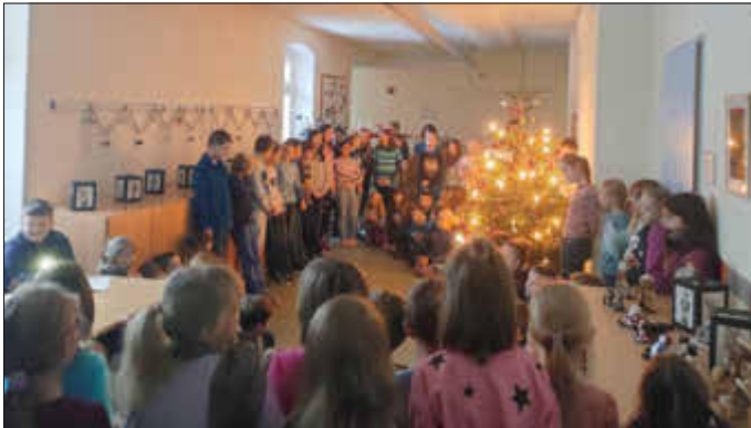
Alle Kinder der Grundschule Niederschöna zum traditionellen Weihnachtssingen.