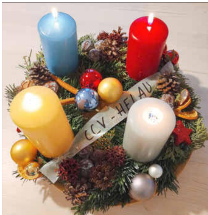
Der CCV wünscht frohe Weihnachten!