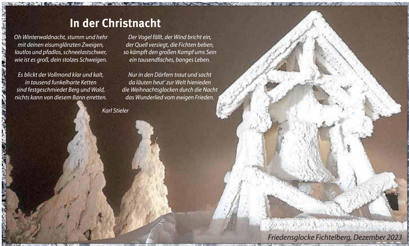
Friedensglocke Fichtelberg, Dezember 2023

Nur in den Dörfern traut und sacht da läuten heut' zur Welt hienieden die Weihnachtsglocken durch die Nacht das Wunderlied vom ewigen Frieden.