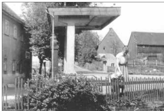
An der Tankstelle im Jahr 1957

Die ursprünglich geplante Anlage (für 2000 l Benzin) wurde nicht errichtet, sondern eine kleinere (800 l), Bauvollendung am 24.11.1928. Es zeigte sich, dass diese nicht lange dem steigenden Kraftstoffbedarf gerecht wurde, so dass 1929 eine Dapolin-Pumpanlage D 5 mit 5000 l Fassungsvermögen eingebaut wurde. 1934 erfolgte eine nochmalige Veränderung und Überdachung der Anlage. Wer weiß noch, wie lange die Tankstelle betrieben wurde? Vor 65 Jahren gab es sie noch.