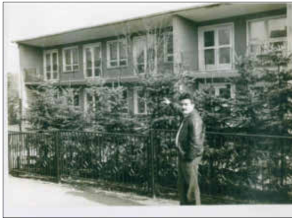
Vor ehemaliger Kinderkrippe Geschwister-Scholl-Straße