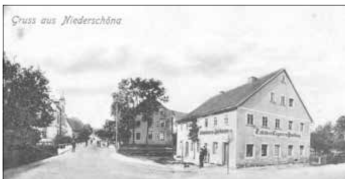
Ansichtskarte um 1910

Dass der neue Besitzer das Haus durch werbewirksame Aufschriften neu gestalten ließ, zeigt diese Ansichtskarte.