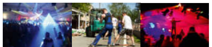
Abbildung 1 "Krach am Bach", Berthelsdorf

Bitte meldet euch bis 30.03.2022 für das erste Treffen bei obenstehender E-Mail.