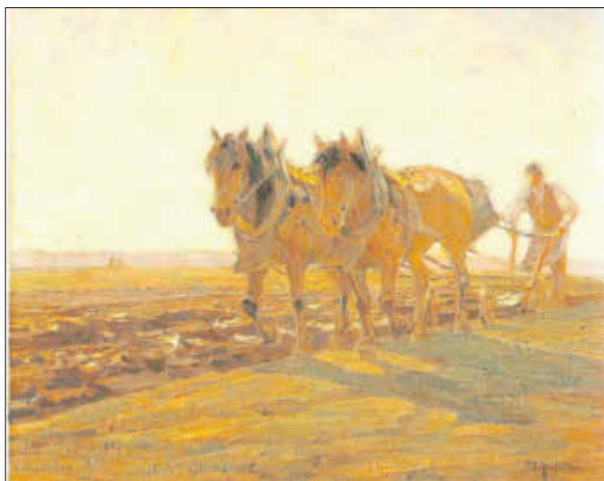
Mit Rössern pflügender Bauer. Gemälde von Friedrich Eckenfelder, 1908