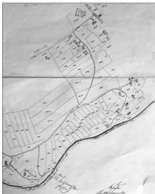
Die Röhlingschen Hufen im dorfnahen Bereich vor ca. 100 Jahren.